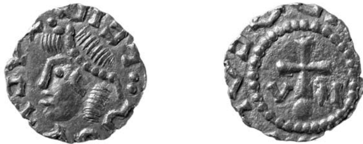
Abb. 1 (Mst. 3:1).