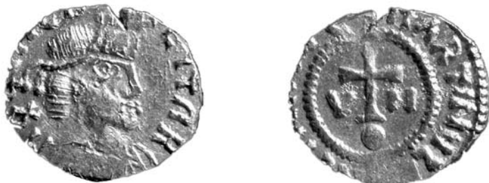
Abb. 2 (Mst. 3:1).